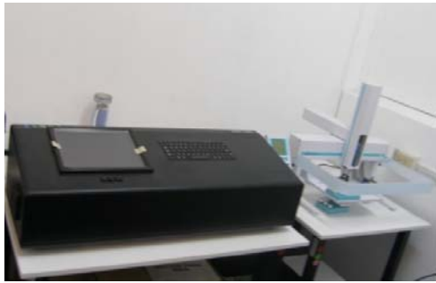
Figura 5. Espectrómetro láser.

- Los muestras son analizadas en el Espectrómetro Laser LGR (Figura 5) y tratados para la obtención de los resultados.