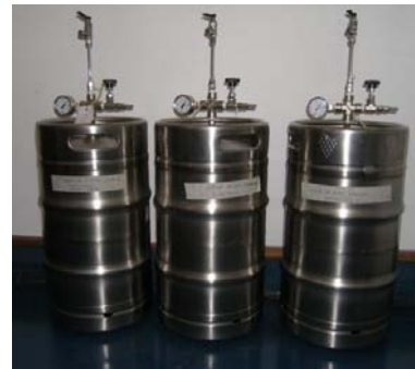
Figura 2. Recipientes de aluminio.

- El almacenamiento de los recipientes se realizó en un ambiente donde no había presencia de luz directa y se evitó un lugar de alta temperatura para evitar la evaporación, evitando abrirla constantemente para prevenir la contaminación. Antes de extraer las muestras se agitaron los recipientes para un buen mezclado de los patrones.