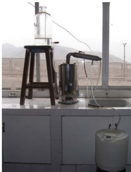
Figura 1. Sistema de destilación de agua.

- Las muestras de agua colectadas se destilan a través del sistema de destilación presentado en la Figura 1: