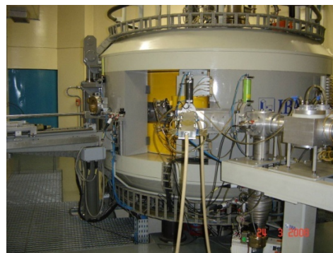
Figura 1. Vista de un ciclotrón.