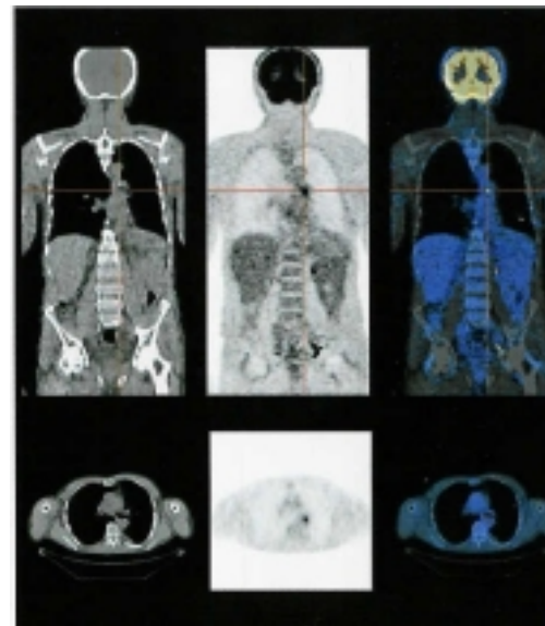
Figura 2. Imagen PET de cuerpo entero.

PET es un proceso de diagnóstico por imagen tridimensional más avanzada y precisa, en el cual se administran a los pacientes radionúclidos emisores de positrones (electrones con carga positiva), que son generados por medio de un ciclotrón. Mediante esta técnica se obtiene información dinámica del funcionamiento de los órganos o tejidos objeto de estudio, permitiendo determinar su metabolismo celular.