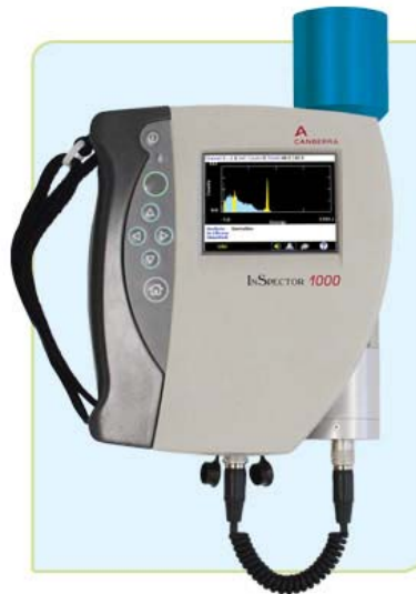
Figura 2. Equipo InSpector 1000, con pantalla para espectro de energía.

Análisis de espectro: Permite identificar Fuentes radiactivas