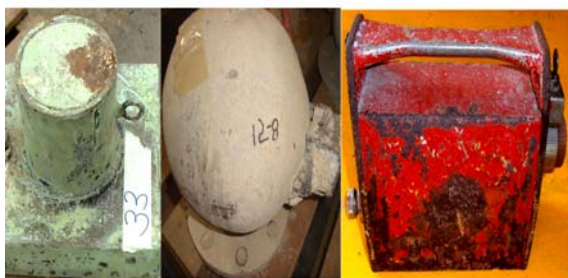
Figura 1. Fuentes radiactivas recolectadas que no presentaban placa de identificación cuando fueron recolectadas.

carecen de sus placas de identificación, así como de su certificado de fabricación, estas fuentes han sido recolectadas por personal de la planta de gestión de residuos radiactivos. Durante un período de tiempo han sido almacenadas bajo condiciones de seguridad, manteniendo las mismas dentro de su blindaje original. Los equipos han sido obtenidos gracias al Proyecto de Reducción de Amenaza Global, mediante un acuerdo suscrito entre el IPEN y el Departamento de Energía de los Estados Unidos de Norteamérica.