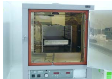
Figura 4. Disposición de la bandeja dentro de la caja de acero inoxidable para su esterilización.