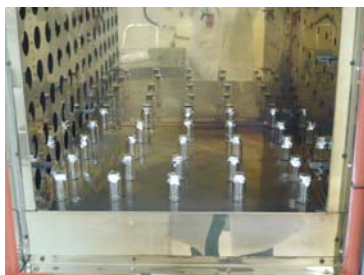
Figura 2. Disposición de los indicadores biológicos dentro de la estufa sin carga de trabajo.