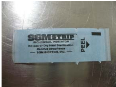
Figura 1. Indicador biológico, cinta que contiene a las esporas del Bacillus atropheus .

* Cada ensayo se utilizó 25 indicadores Medio CTS: Caldo Triptocasa de Soya. +: Crecimiento microbiano. -: Sin crecimiento microbiano