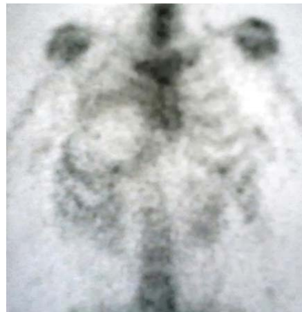
Figura 1. Muestra la gammagrafía ósea de una paciente con cáncer en la mama derecha, sometida a mastectomía y reconstrucción con colgajo TRAM; presenta disminución de la captación del radiofármaco en la zona del colgajo, con halo hiper captador, se confirmó necrosis grasa.

En las Figuras 2 y 3 se aprecian gammagrafías óseas en las que no existen anomalías en la zona de las mamas, por tener un adecuado resultado de reconstrucción mamaria.