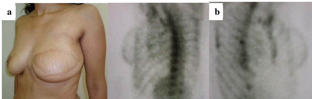
Figura 2. (a) Paciente mujer de 33 años, con cáncer de mama izquierdo y reconstrucción tipo TRAM realizados en el 2011. (b) La gammagrafía ósea muestra la mama reconstruida con resultados estéticos adecuados.