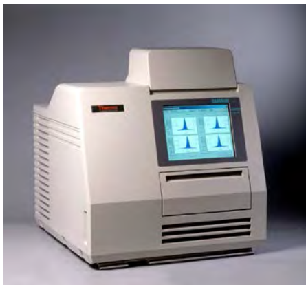
Figura 1. Lector Harshaw TLD 6600 PLUS [3].

lectura de los detectores y producir el efecto termoluminiscente.