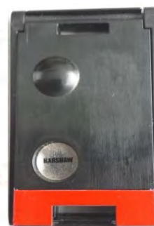
Figura 3. Dosímetro TLD modelo 8825.